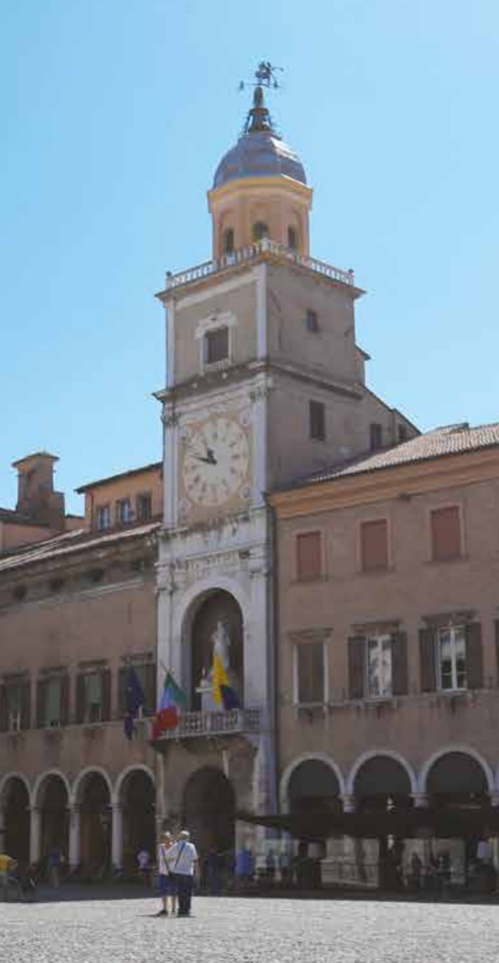
Da sinistra a destra: Palazzo Comunale, Sala della Torre Mozza, Camerino dei Confermati, Sala del Fuoco, Sala del Vecchio Consiglio, Sala degli Arazzi, Stemma di Modena nella Sala dei Matrimoni.